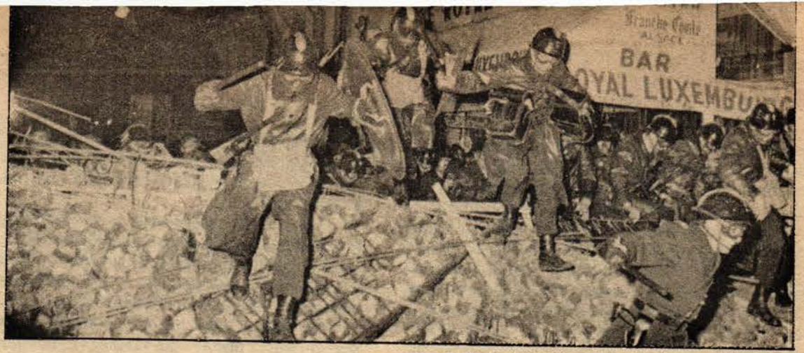
Polis, Paris'te öğrenci barikatlarına saldırıyor...