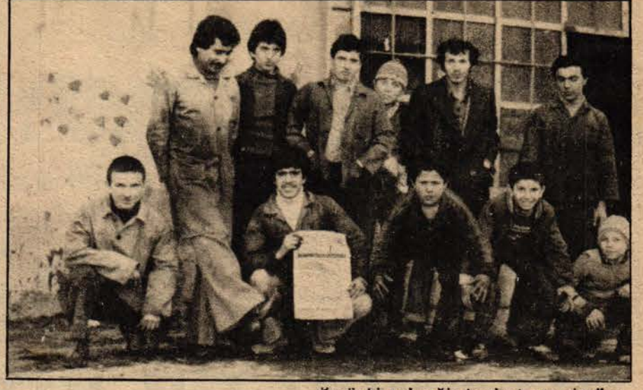
Özgür bir geleceğin teminatı genç işçiler...